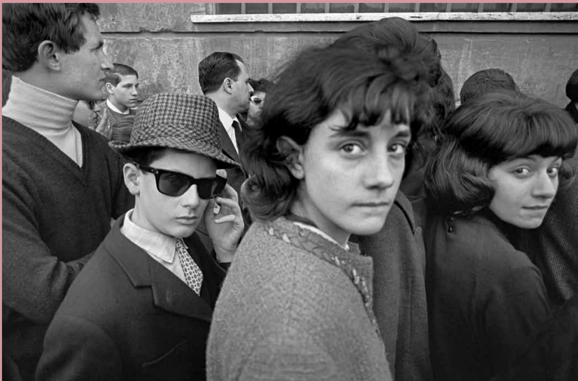
Rome, 1966

Lo sguardo del fotografo Magnum sul nostro Paese